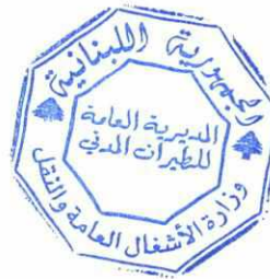
المهندس فادي الحسن